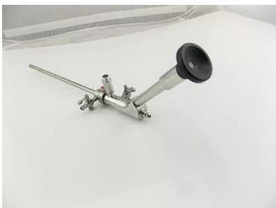
Endoscópio para Otorrinolaringologia