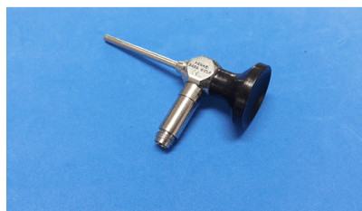
Endoscópio para laparoscopia